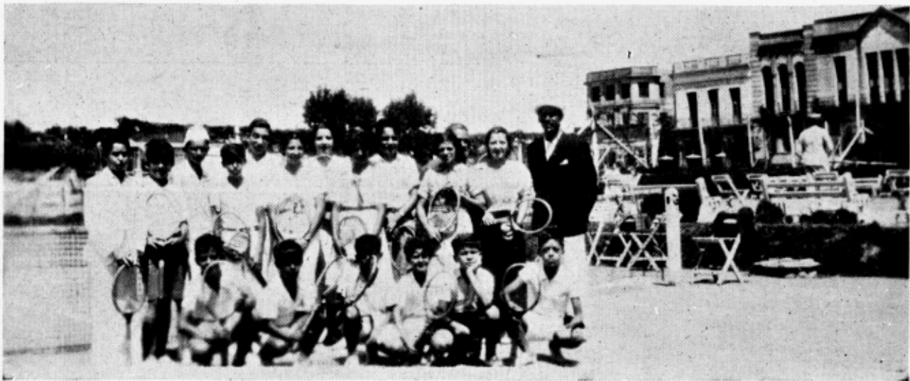
A TURMA INFANTIL QUE TOMOU PARTE NO ÚLTIMO TORNEIO

melhor responde às necessidades da juventude moderna.