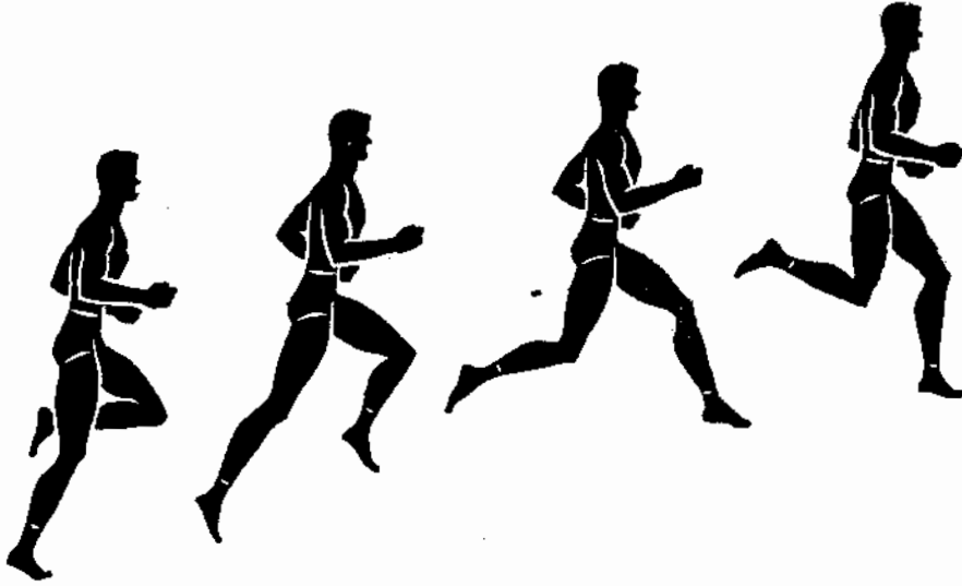
A CORRIDA RÚSTICA CONSTITUI UM DOS PROCESSOS MAIS ACONSELHADOS NO TREINAMENTO FÍSICO MILITAR

Desportos Coletivos — Serão praticados o futebol, o basquetebol e o