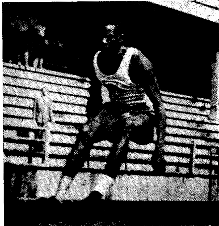
UM SALTO ESPETACULAR DE ADEMAR FERREIRA DA SILVA, NA SUA PREPARAÇÃO PARA AS OLIMPIADAS, ONDE OBTVEU O 1.º LUGAR NO TRÍPLICE SALTO